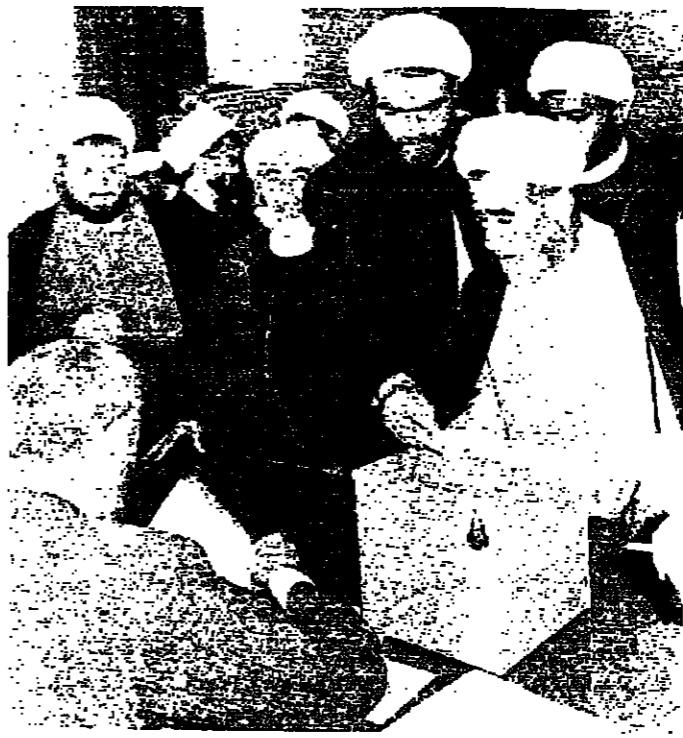
بعض اصحاب الفصيلة العلماء يملكون باصواتهم

وقد على سبحة الإمام الصدر على النتائج بعد إعلانها ، بتصریح قال فيه : أنني أحمد الله وأشكره بالسعادة الفائقة ، لاجل الذي جرت فيه الانتخابات الشرعية والتجريبية ، فقد كان مشحوناً بالزخامة والاحبال والحفاص ، وكان علينا بحسب التقديرات ، وهذا يدل على المستوى الرفيع للقطاعات المختلفة من أبناء الطائفة الإسلامية الشيعية .